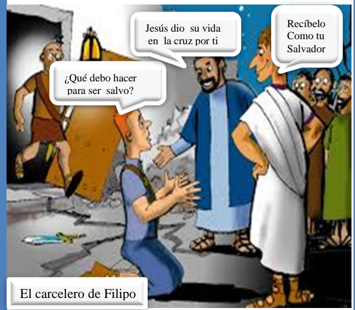
El carcelero de Filipo

Encuentre la salvación del alma a través de Jesucristo Porque de tal manera amó Dios al mundo, que ha dado a su Hijo unigénito, para que todo aquel que en él cree, no se pierda, mas tenga vida eterna (Juan 3:16)